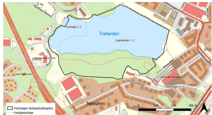
Föreslaget biotopskyddsområde i Trekanten.

För att säkerställa att biotopskyddets syfte att bevara och på sikt även utveckla de naturvärden och den biologiska mångfald som är knutna till Trekantens strand- och vattenmiljön får genomslagskraft önskar förvaltningen avveckla befintligt hundrastområde.